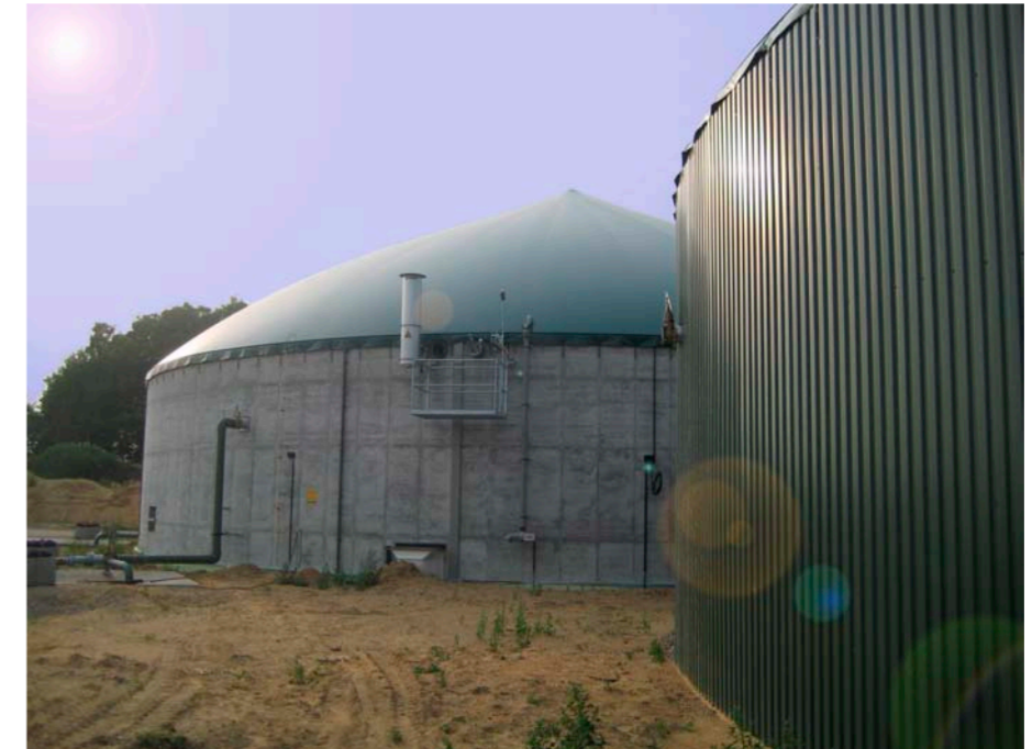
Biogasanlage bei Scheeßel